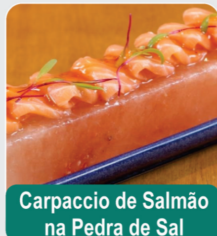
Carpaccio de Salmão na Pedra de Sal