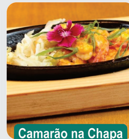
Camarão na Chapa

RODÍZIO COMPLETO COM LULA, CAMARÃO E SOBREMESA