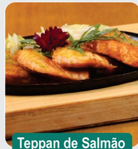
Teppan de Salmão